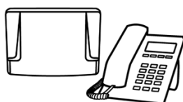
Central Telefônica e Telefone