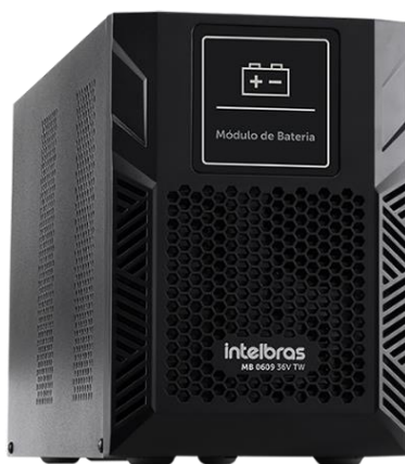
MB 0609 36V TW

Módulo de baterias externas 36 V (6 x 9 Ah)