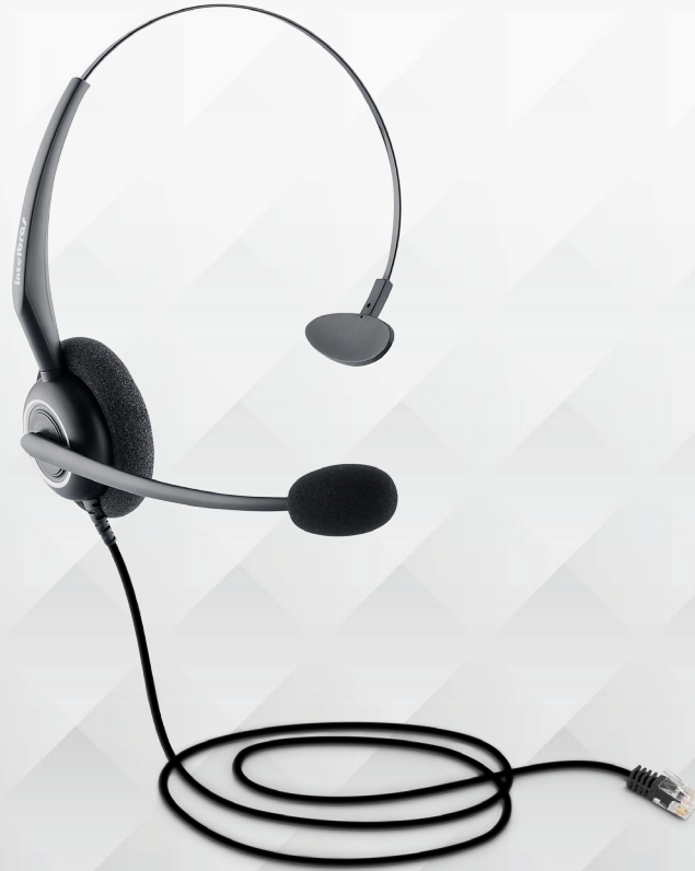
Headset mono RJ9