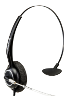
THS 55 USB Headset mono USB