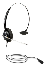
THS 55 QD Headset mono QD