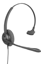
CHS 60 Headset mono QD