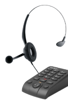
HSB 50 Telefone headset